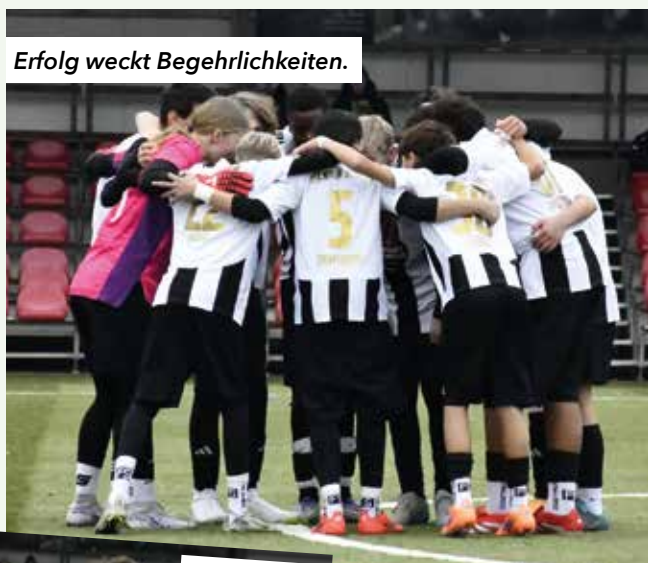
Erfolg weckt Begehrlichkeiten.