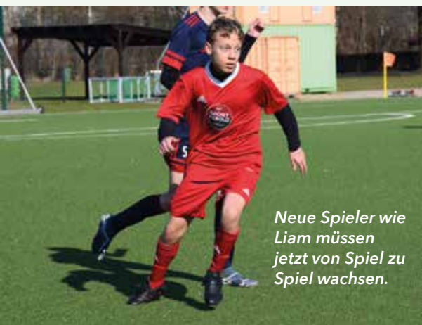
Neue Spieler wie Liam müssen jetzt von Spiel zu Spiel wachsen.

Trotz der schwierigen Ausgangslage zeigt die Mannschaft Zusammenhalt und arbeitet weiter daran, sich von Spiel zu Spiel zu steigern.