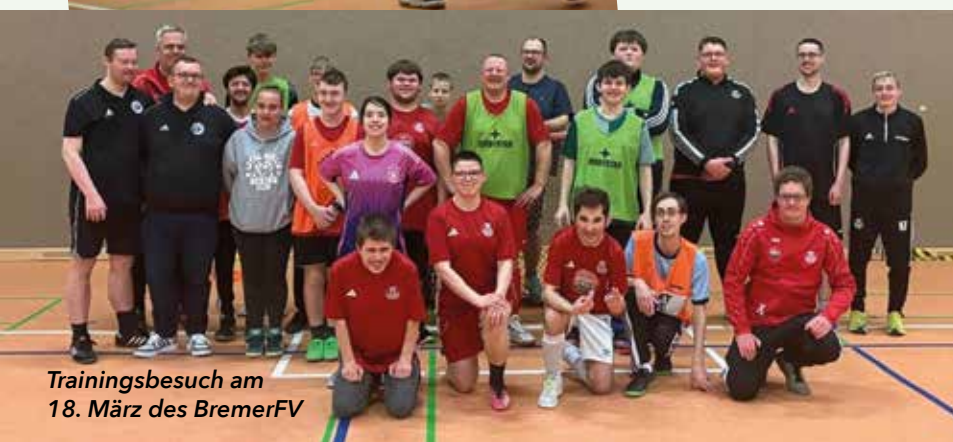
Trainingsbesuch am 18. März des BremerFV