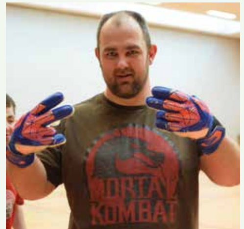
So sieht Freude aus im Tor stehen zu dürfen.