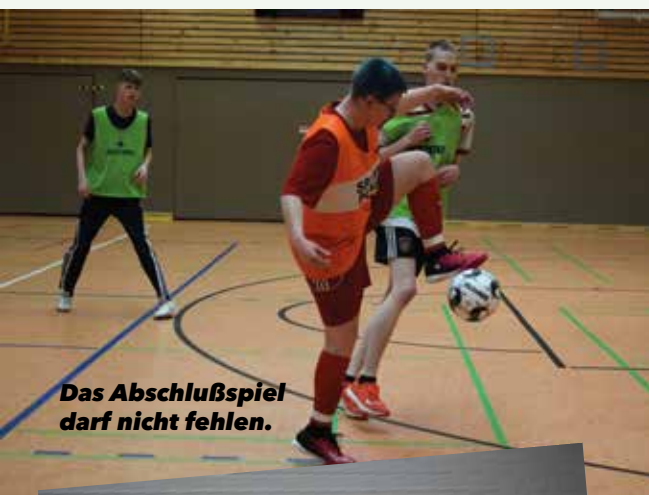
Das Abschlußspiel darf nicht fehlen.