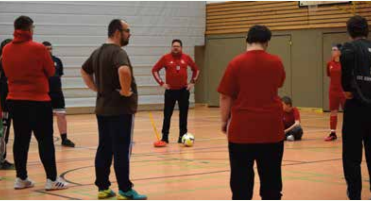
Ansprache vorm Training

Am 11. Februar 2026 waren wir bei der Vorbesprechung der Bunten Liga Bremen in den Räumlichkeiten des Bremer Fußball-Verbandes