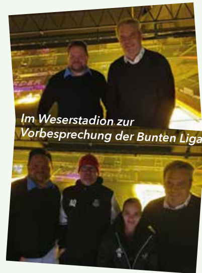
Im Weserstadion zur Vorberechung der Bunten Liga

Unterstützt durch die Sparkasse Bremen stehen weiterhin der Spaß am Spiel, das Miteinander und die gelebte Inklusion im Mittelpunkt.