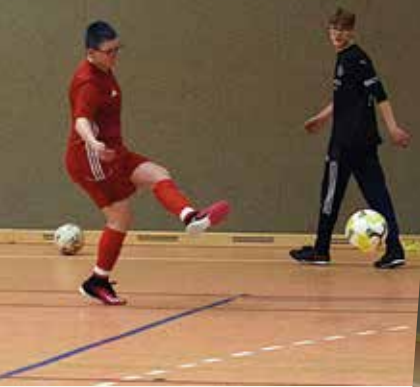
Sehr beliebt sind die Torschussübungen.