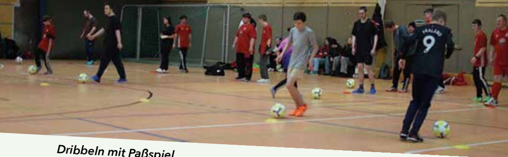
Dribbeln mit Paßspiel

über die gesamte Saison hinweg ein hohes Maß an sportlicher Spannung sowie faire Wettbewerbsbedingungen zu gewährleisten.