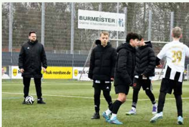
Die Testspiele als Trainingseinheit genutzt.